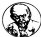
Centro Studi Luigi Pirandello